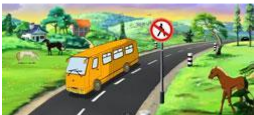
Дорога и знаки