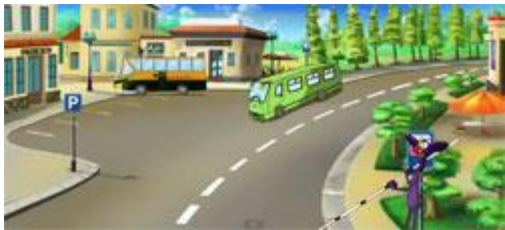
В плохую погоду