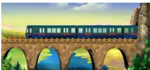
Метро и железная дорога