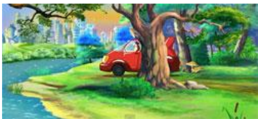
Мальш и авто