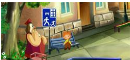
Во дворе и подъезде